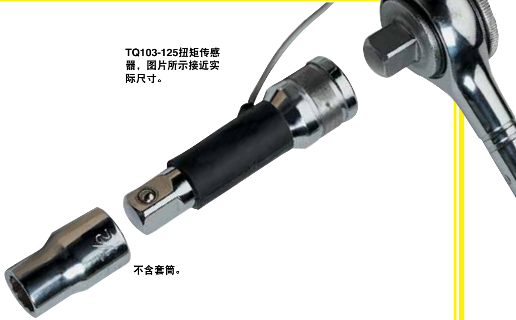
TQ103-125扭矩传感器，图片所示接近实际尺寸。